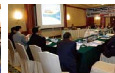
道路関係国際会議