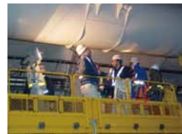
設備研修(現場実習)