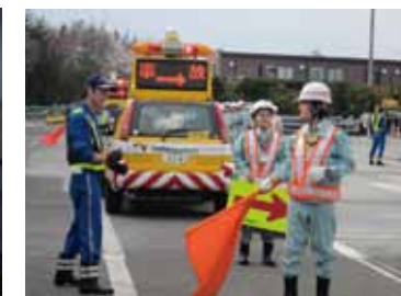
交通管理研修(現場実習)