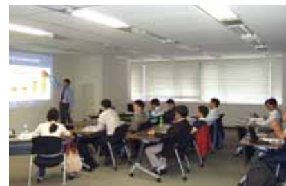
技術専門研修(講義)

現場実習と講義をバランス良く組み合わせた研修プログラムを理解度に応じて実施しています。大規模な現場を活かした研修や、専門家による研修など、NEXCO中日本グループにしかできない研修プログラムとなっています。